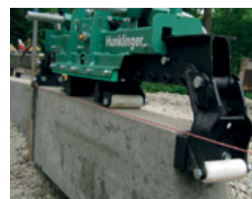
Układanie wzdłuż wyznaczonej linii Precyzyjne układanie obok siebie dzięki wzdłużnemu chwytaniu.