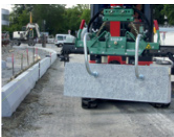
Chwytak do krawężników S100

Chwytaki wielofunkcyjne S100 i S400 zapewniają szeroki wachlarz wymiennych szczęk do wszelkiego rodzaju zadań na placu budowy.