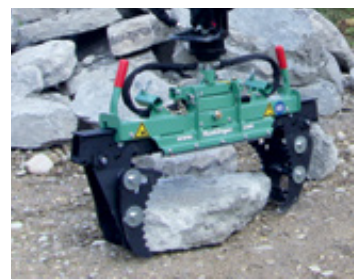
Chwytak do kamieni S100