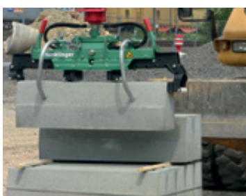
Samodzielne podnoszenie krawężnika bezpośrednio z palety.