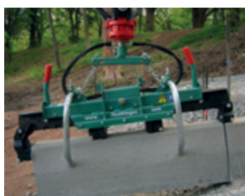
Precyzyjne układanie krawężnika Chwytnak pozwala na dokładne ułożenie krawężnika.