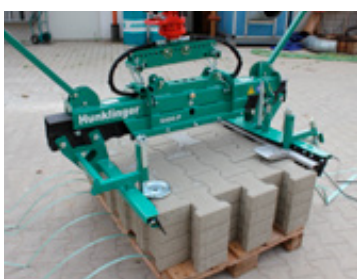
Chwyć i podnieś z palety...