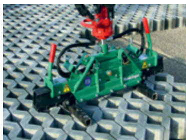
Chwytak do płyt ażurowych S100